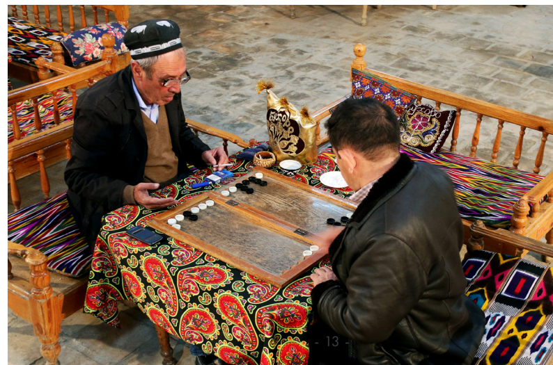
乌兹别克的年长男士在玩双陆棋