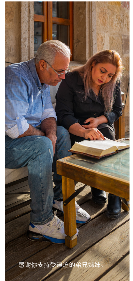
感谢你支持受逼迫的弟兄姊妹。