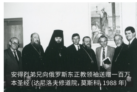
安得烈弟兄向俄罗斯东正教领袖送赠一百万本圣经 (达尼洛夫修道院, 莫斯科, 1988年)

我们一点一点地看到当局态度的变化。我认为神赋予了戈尔巴乔夫这个角色，神使用他打开帷幕，就是那道封闭苏联的铁幕。