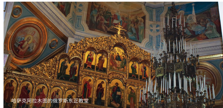
哈萨克阿拉木图的俄罗斯东正教堂

就我个人而言，那日子让我变得更坚强。我们靠祈祷支撑着，与主耶稣的沟通是无比重要的。