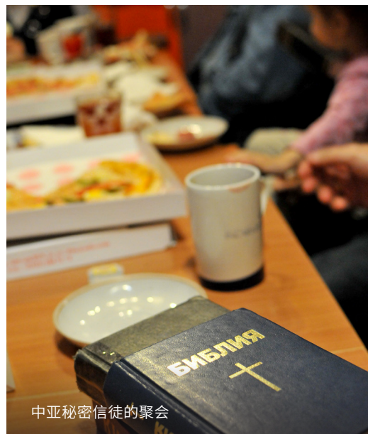
中亚秘密信徒的聚会