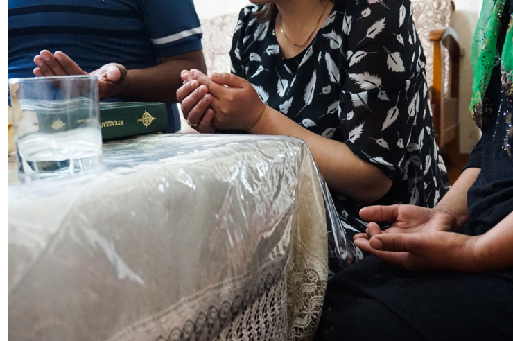
中亚地下教会的聚会