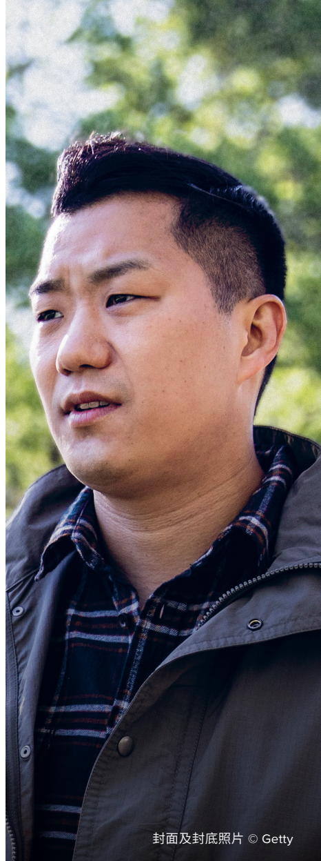
封面及封底照片