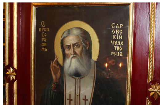
哈萨克阿拉木图的俄罗斯东正教堂

信仰逼迫是不争的事实：罚款、骚扰、歧视、监禁。在60年代初，赫鲁晓夫领导的新一轮逼迫席卷全国，当局有权将孩子从基督徒父母的身边带走，送到孤儿院，以便名正言顺地交由国家教养。