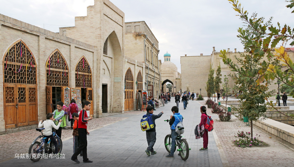
乌兹别克的坦布哈拉

“鱼缸里的鱼”随之而来的是沦为二等公民、被社会排斥、权利受到限制的挑战，凡此种种都大大地窒碍事业发展。进入大学几乎是不可能的，从政或进入政府架构更是妄想。这都是我们在苏联时期作为基督徒必须面对的。